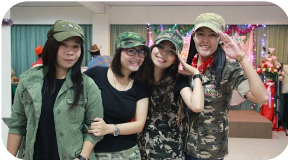
กิจกรรมร่วมกัน