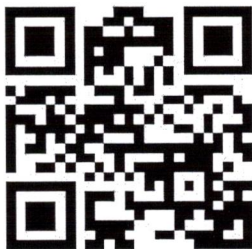
ลงทะเบียนออนไลน์